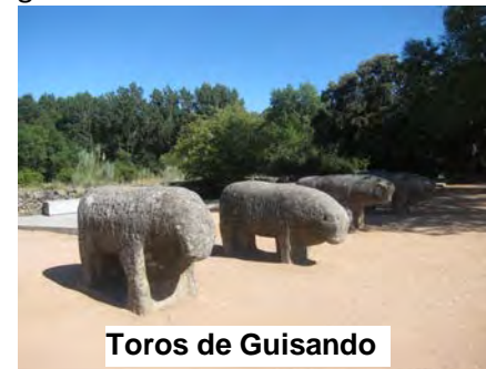
Toros de Guisando

El Castañar del Tiemblo.- En la Reserva Natural del Valle de Iruelas se encuentra un inmenso castañar colmado de majestuosos ejemplares de castaños que se funden con robles, alisedas, avellanos, pinos y acebos. Una senda que nos sumerge en un soñado bosque de colosos que resulta casi exclusivo en su especie.